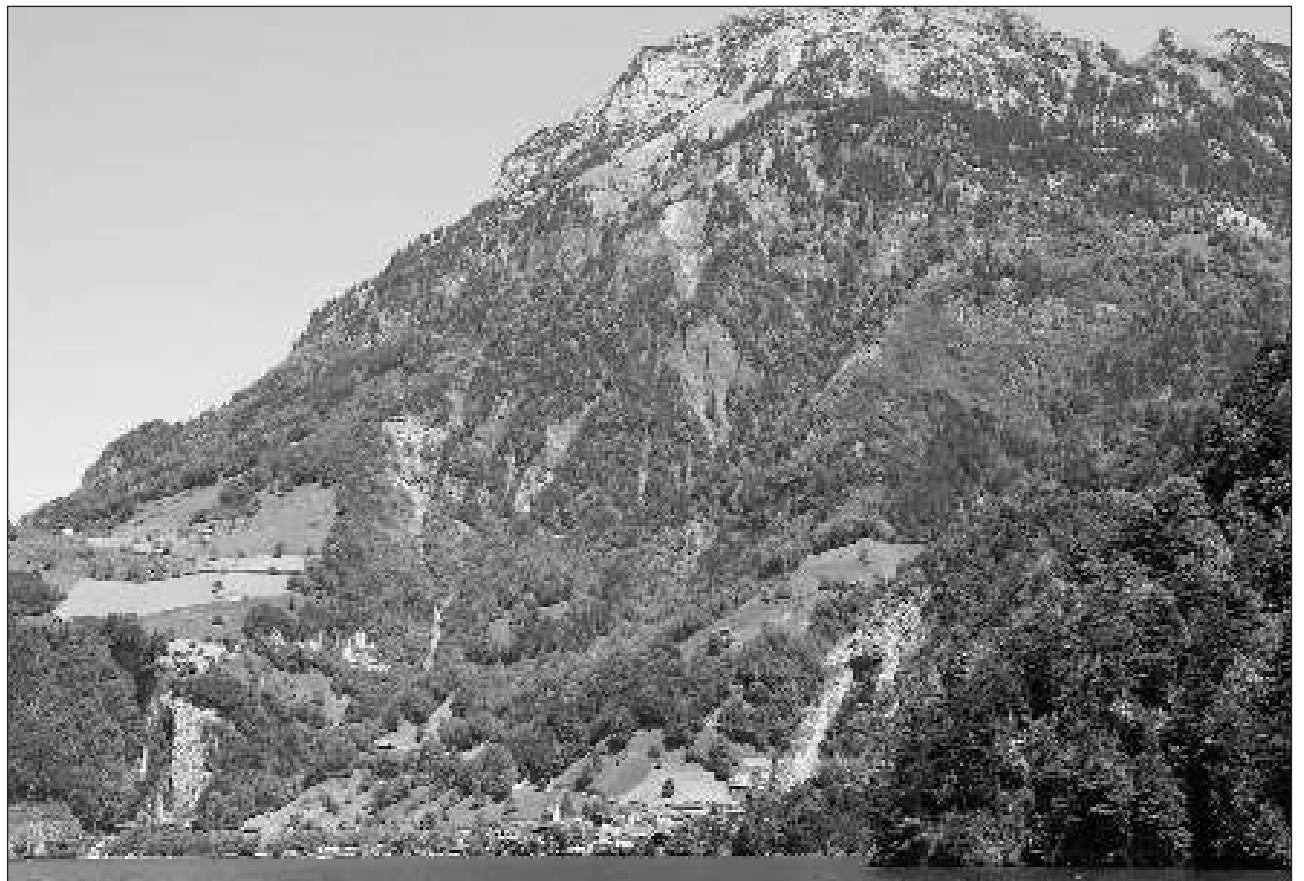
Vor Sisikon erfolgt der unterirdische Abbau: Etwas ausserhalb des Dorfes (links oben ist die Liegenschaft Läntigen zu erkennen) soll Fels abgebaut werden.