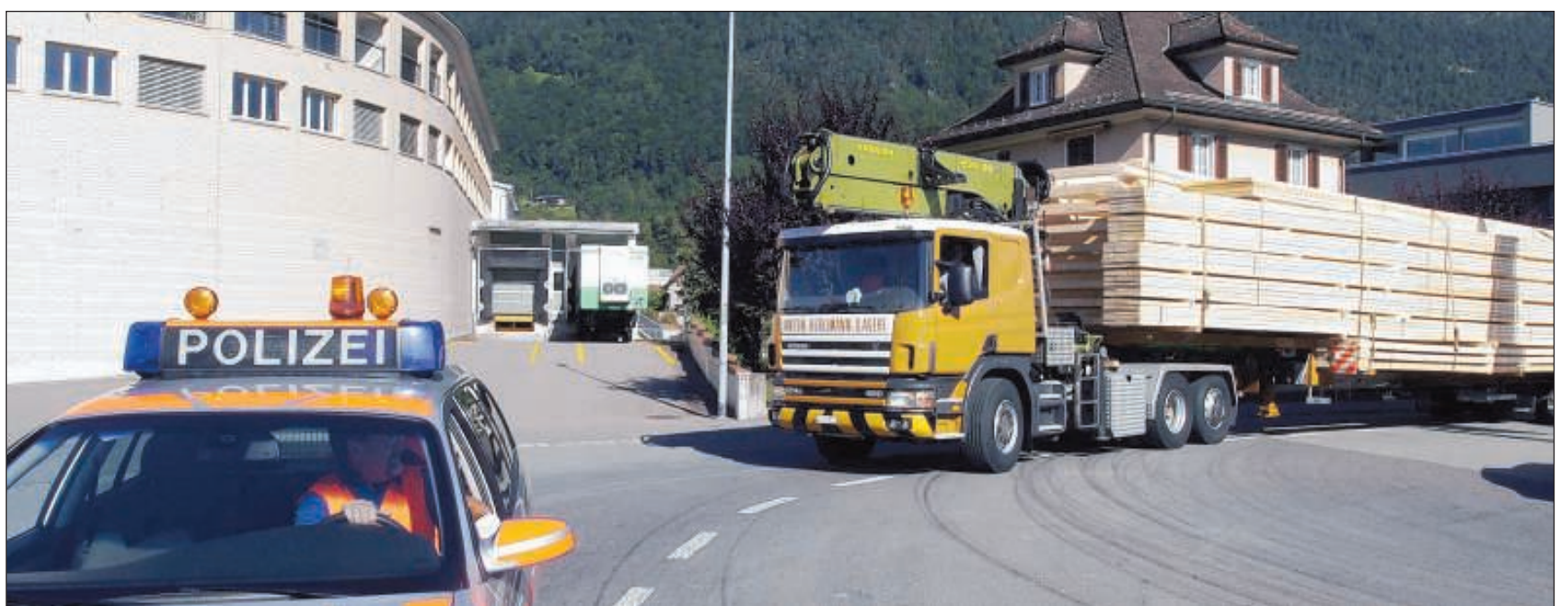
Grosse Bedachung für Aldi: Eine echte Herausforderung für die Plattenbinder-Konstruktionen der Firma Dettling Holzbau stellt der Transport mit Polizeibegleitung (hier beim Start in Brunnen) dar.

damm Plaza in Pfäffikon (5. Rang). Die Hoteliers erwarten jeweils das Wahlergebnis mit Spannung. Es zeigt auf, welche Seminarhotels in den Augen der Kundschaft die beliebtesten sind. Denn es sind die Seminarveranstalter, die sich in einem Hotel wohl gefühlt haben und entscheiden, wo das nächste Seminar durchgeführt werden soll. Und sie sind es, welche den Seminarhotels die begehrten Punkte verteilen.