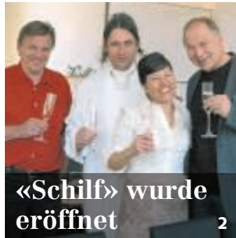
«Schilf» wurde eröffnet 2

Bote der Urschweiz Schmidgasse 7, 6431 Schwyz www.bote.ch Redaktion: Fon 041 819 08 11 Fax 041 811 70 37 redaktion@bote.ch Abonnemente: Fon 041 819 08 09 Fax 041 819 08 53 abo@bote.ch Inserate/Anzeigen: Fon 041 819 08 08 Fax 041 819 08 17 inserate@bote.ch