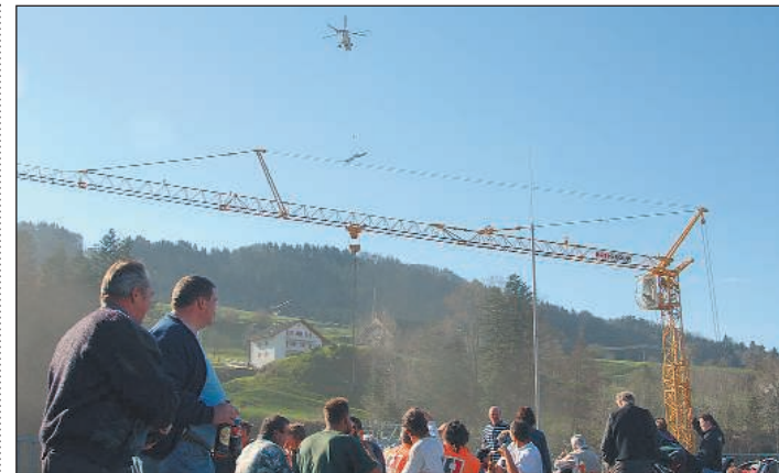
Das Wetter spielte für die Bahnbauer mit: Von der improvisierten Beiz aus konnten die Schaulustigen den Einsatz des Riesen-Helikopters mitverfolgen.